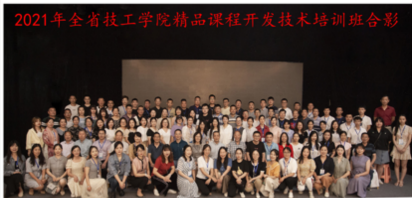
2021年全省技工学院精品课程开发技术培训班合影